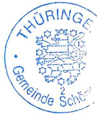
..... Böttcher Bürgermeister der Gemeinde Schöngleina