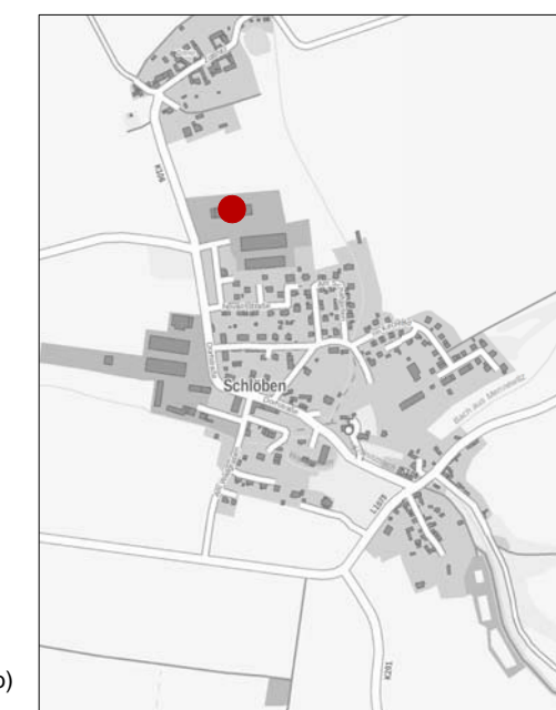
Lage im Gemeindegebiet (Darstellung ohne Maßstab)